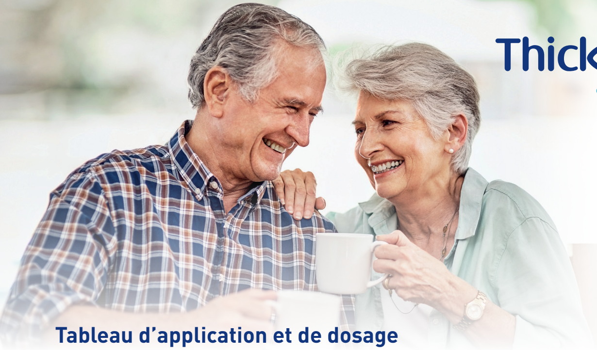
Tableau d'application et de dosage de ThickenUP ® clear selon la nouvelle classification IDDSI

Selon le niveau d'épaississement souhaité et prescrit, mettez d'abord la poudre ThickenUP ® clear dans le gobelet doseur, ajoutez la boisson/le liquide et remuez pendant 20 à 30 secondes. Laissez reposer la boisson pendant le temps indiqué dans le tableau pour obtenir la bonne consistance. Versez ensuite la boisson dans le récipient prévu à cet effet (verre, verre à découpe nasale ou tasse préchauffée) et servez.